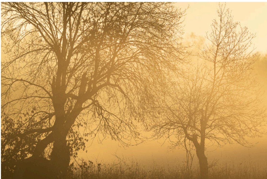
Lever du jour dans les prairies adjacentes à la forêt de Białowieża, en Pologne

« Le monde ne mourra jamais par manque de merveilles mais uniquement par manque d'émerveillement. »