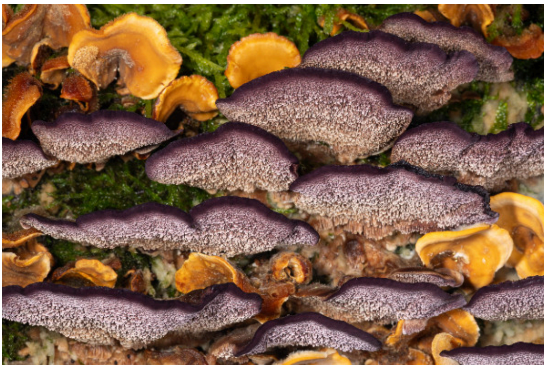
Trichaptum bifforme - Tramète du chêne-liège sur un chablis de Charme commun dans la forêt de Białowieża en Pologne