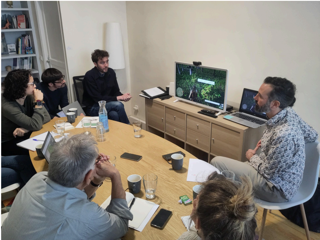
Réunion de travail préliminaire pour parcourir l'étendue du sujet... avec pop-up urbain et l'association ARC

Créer les conditions de renaissance d'une forêt primaire en Europe de l'Ouest implique de questionner les récits et les représentations de la forêt dans nos imaginaires collectifs.