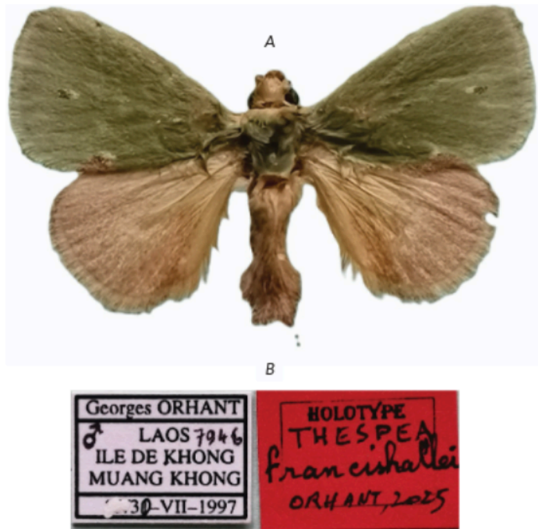
Figure 1. – A) Holotype. B) Étiquettes.

Nous apprenons avec émotion en ce début de printemps qu' une nouvelle espèce de papillon, découverte au Laos , a été baptisée en l'honneur de Francis Hallé par l'entomologiste Georges E.R.J. Orhant : Thespea francishallei est le nom de ce papillon jusqu'alors inconnu.