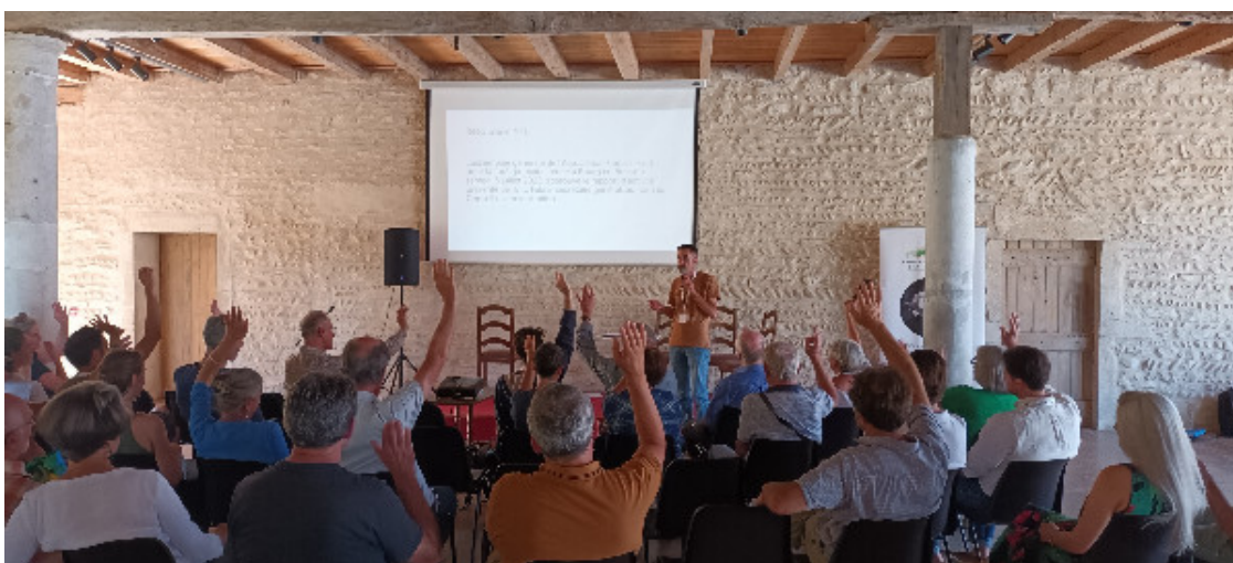
Validation des résolutions lors de la dernière assemblée générale de l'association

À vos agendas ! L'assemblée générale de l'association se tiendra cette année le 27 juin à Strasbourg . Durant cette assemblée générale, conformément aux statuts de l'association, le conseil d'administration sera renouvelé pour une durée de 3 ans : chaque adhérente ou adhérent peut présenter sa candidature motivée à ce titre dès à présent, sous réserve d'en respecter les conditions décrites au lien ci-dessous. Les candidatures seront ouvertes jusqu'au 31 mai minuit.