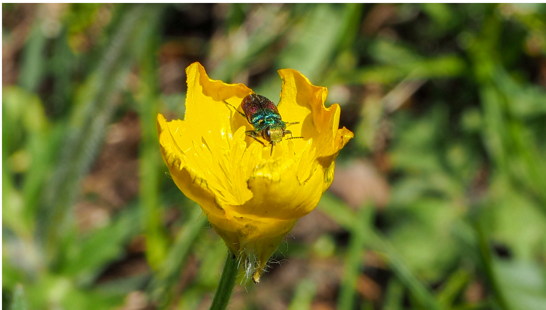
Photo extraite du kit pédagogique Scarabée dans la forêt de la Massane

Le Kit pédagogique de l'association constitue une excellente entrée en matière pour comprendre les enjeux liés aux forêts naturelles et commencer à en parler autour de soi. Nous nous réjouissons de constater que vous êtes nombreuses et nombreux à vous y former et y faire référence dans vos démarches.