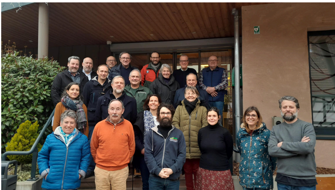
Les participants réunis lors des ateliers organisés autour des préconisations sur le devenir du massif de l'Œdenwald

Depuis un an, l'association participe à une série d'ateliers de concertations organisés par la Ville de Strasbourg pour co-construire un scénario de transition vers la libre évolution d'une partie du massif forestier de l'Œdenwald, dont la Ville de Strasbourg est propriétaire.