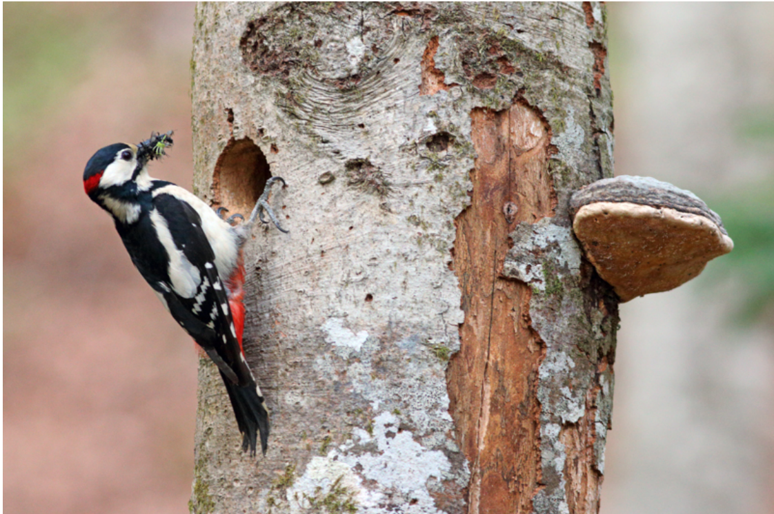
Photo extraite du kit pédagogique Pic épeiche - Dendrocopos Major © Julien Arbez

Le Kit pédagogique de l'association constitue une excellente entrée en matière pour comprendre les enjeux liés aux forêts naturelles et commencer à en parler autour de soi. Nous nous réjouissons de constater que vous êtes nombreuses et nombreux à vous y former et y faire référence dans vos démarches.