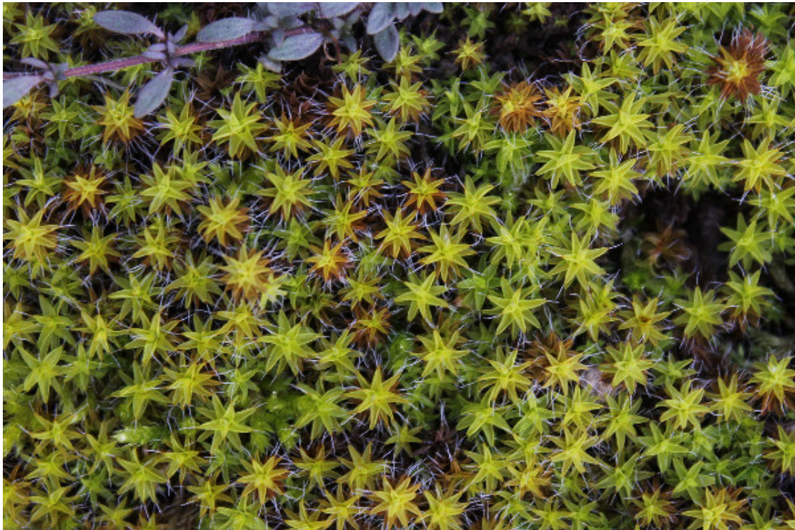
Syntrichia ruralis © Nils Peronnet

L'humanité les côtoie sur tous les continents et dans une infinité de climats, et pourtant, ces plantes sont aussi discrètes que méconnues .