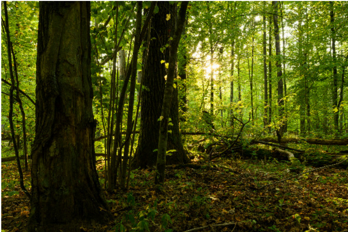
Forêt de Białowieża, Pologne

« Oui, c'est un défi, bien sûr. Il va falloir que ça soit transgénérationnel. C'est clair que moi, je ne verrai pas le résultat de cette expérience. Mais je trouve que c'est beau, et que c'est à l'honneur de l'être humain de savoir faire ça. »