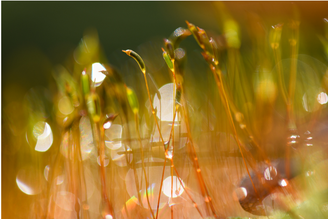
Mousses dans la forêt de Białowieża, Pologne